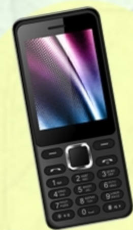
Телефон – для связи

Предметы, которые пригодятся, если вы заблудились в лесу: