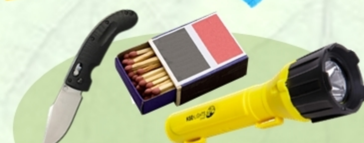
Нож, спички (зажигалка), фонарик, веревка