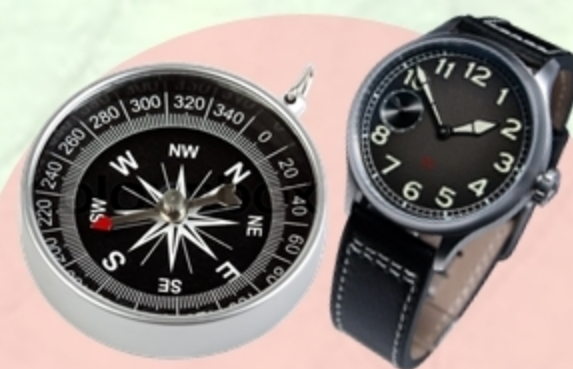
Компас или часы со стрелками – для ориентирования